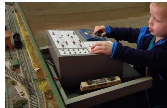
Op de jeugd baan kunnen kinderen zelf treinen laten rijden en wissels en seinen bedienen

Bent u op zoek naar een leuke kinderactiviteit voor uw bedrijf of wilt u een verjaardagspartijtje organiseren? Wij bieden u graag een gevarieerd programma om kinderen te vermaken.