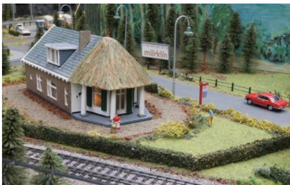
Tolhuisje, Landgoed Hoekelum, Bennekom

Onze leden rijden met H0 (1:87), N-spoor (1:160), Z-spoor (1:220), een spoor-I (1:32) of spoor-II (1:22,5) banen van o.a. de merken Märklin, Fleischmann, Roco Trix Express en LGB; zowel analoog, de oude manier van rijden, als digitaal door besturing met behulp van elektronica en computer.