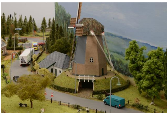
De Keetmolen in Ede

Op 23 december 2008 is de vereniging Promospoor opgericht.