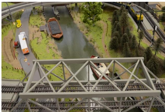
Detail van de 3-rail baan

Daarnaast zijn we gestart met het bouwen van een modelbaan op schaal N.